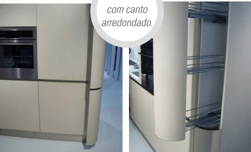
Cozinha com canto arredondado.