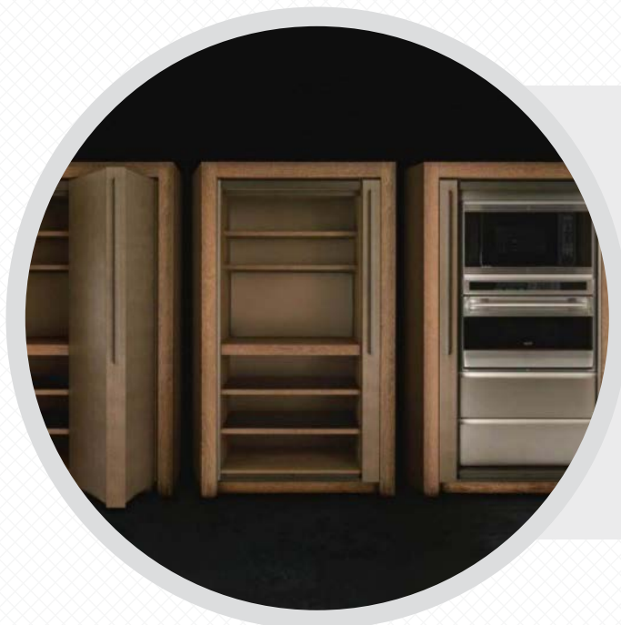
COZINHA ARMANI DADA.

Fique atento! A crise econômica europeia impeliu diversos fabricantes mundiais a buscarem outros mercados e, com isso, surgiram novos fornecedores no Brasil, alargando a oferta desses produtos e derrubando os preços.