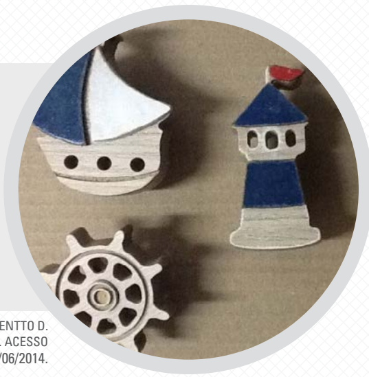
COMPLEMENTTO D.

A empresa Complementto D , de Maceió/AL produz puxadores para móveis com sobras de MDF. Esse recurso amplia a oferta de produtos especiais dos pequenos fabricantes de móveis e pode gerar novos negócios, considerando o diferencial competitivo de reaproveitar sobras de matéria-prima, para a geração de novos produtos.