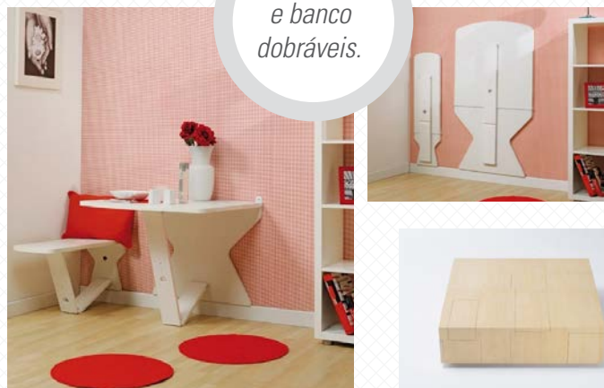
Mesa e banco dobráveis.