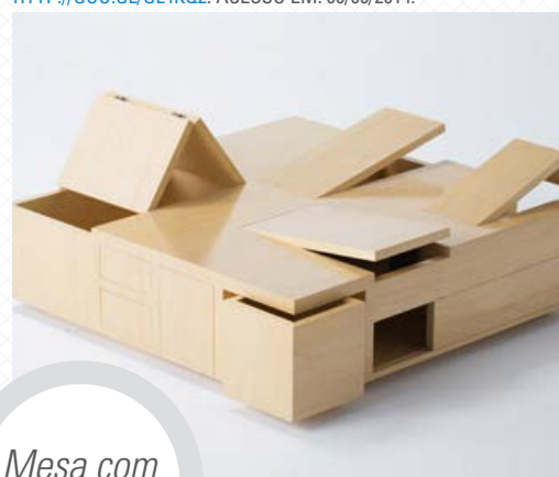
Mesa com vãos.