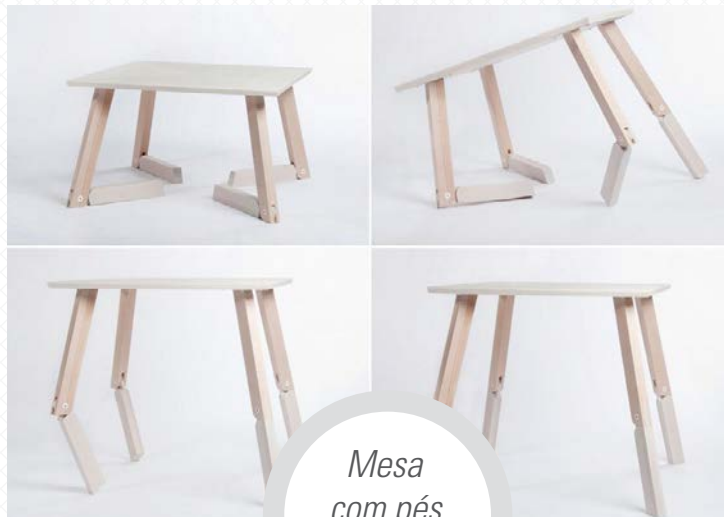
Mesa com pés articuláveis.